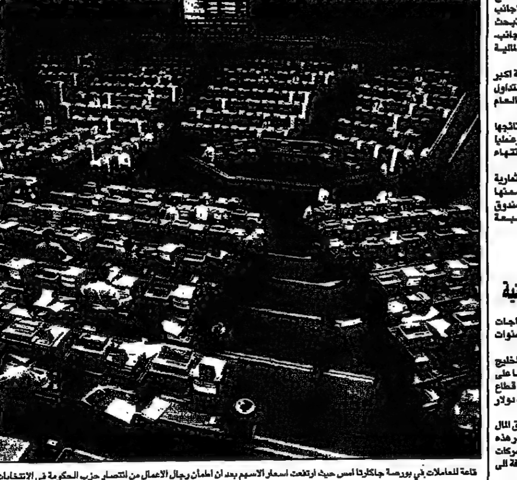
قاعة للمعاملات في بورصة جاكارتا أسس حيد ارتفعت اسعار الاموال بعد ان اطمأن رجال الاعمال من انتصار حزب الحكومة في الانتخابات

نيويورك - رويترز - ذكرت نشرة ميسر ان أسس الاثني ان انتاج اناداركو سيصل الى 180 ألف برميل يوميا من حقول حاسي بركين.